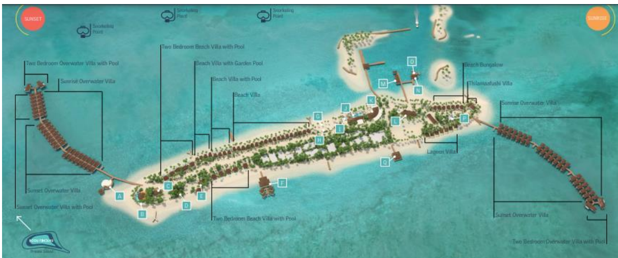
LE MERIDIEN MALDIVES RESORT & SPA MAP